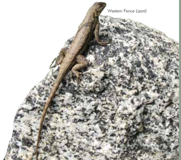
Western Fence Lizard

Mensaje de emergencia L.A. City Parks: (213) 978-4670