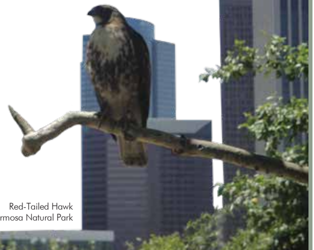
Red-Tailed Hawk at Vista Hermosa Natural Park

Emergency L.A. City Services Dispatch: (213) 978-4670